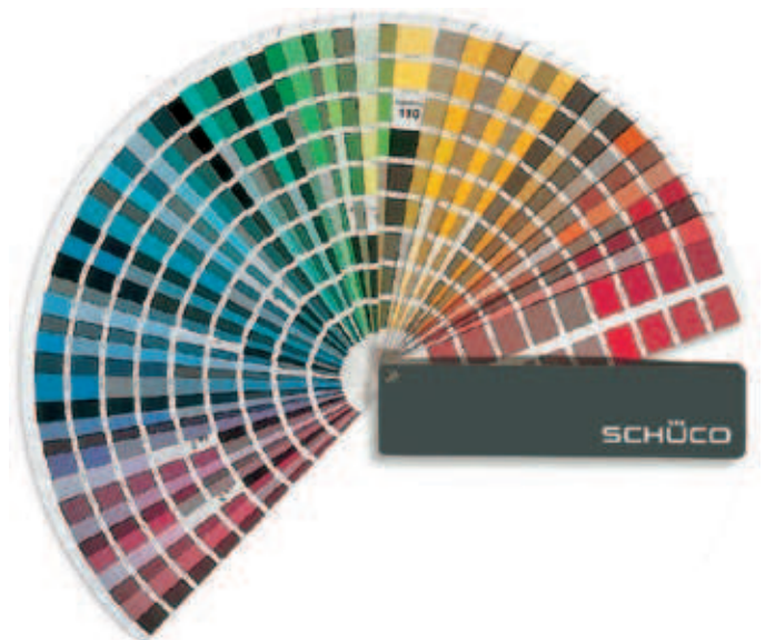
Der farbigen Gestaltung sind mit Schüco keine Grenzen gesetzt.